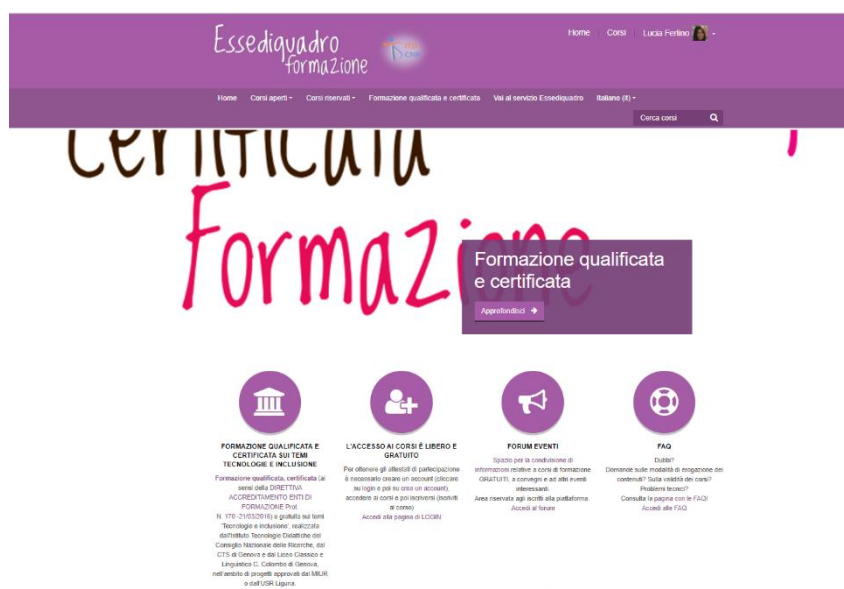
Figura 2 - Home della piattaforma (parte superiore)

Lo spazio allestito ha una struttura semplice ed essenziale (Figura 2). Nel menu in alto sono presenti i link ai corsi disponibili (aperti e riservati), alla direttiva accreditamento che riconosce gli istituti pubblici di ricerca come soggetti qualificati per la formazione del personale della scuola e al sito Essediquadro.