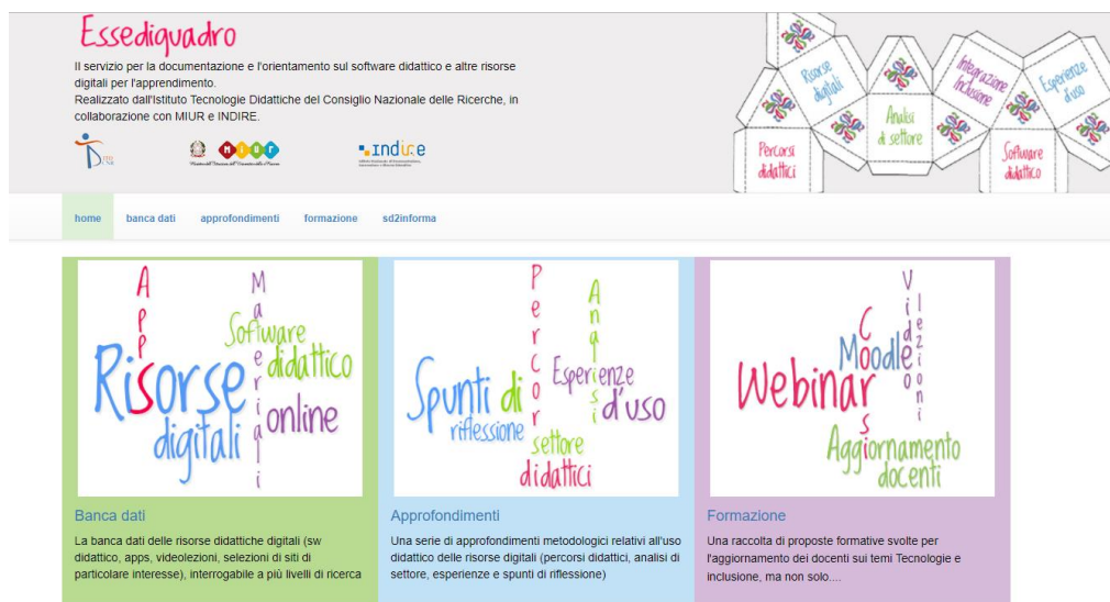
Figura 1 - Il sito Essediquadro e l'accesso alla piattaforma dalla sezione Formazione

Per garantire la fruibilità delle proposte formative nel tempo, per non disperdere i loro contenuti e per poter riconoscere ai fruitori le ore seguite, nel gennaio 2016 è stata sviluppata ed allestita la piattaforma Moodle “Essediquadro Formazione” ( https://sd2.itd.cnr.it/corsiformazione/ ) [2], accessibile dal sito Essediquadro ( https://sd2.itd.cnr.it ), il Servizio di Documentazione sul Software Didattico e altre risorse digitali per l'apprendimento (Figura 1) [3].